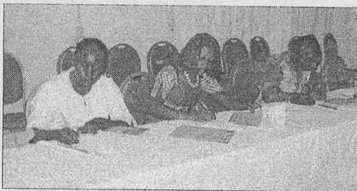
La presse a pris connaissance des objectifs de la 2e phase du PIP.